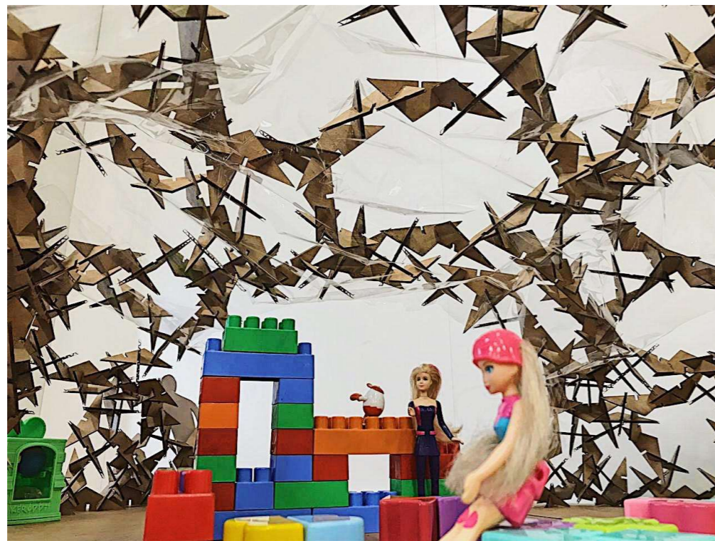
VISTA INTERNA (ÁREA DE ENTRETENIMENTO)

O pavilhão foi pensado e desenvolvido partindo de um módulo com um formato básico de um triângulo escaleno, com 3 cortes estratégicos. Trazendo um ar modernista ao ver a peça. Pode-se perceber que com encaixes tão simples foi possível desenvolver uma forma mais contemporânea, com um toque de desconstrutivismo, alto portante e com uma leveza ao entrar dentro do pavilhão, pois as peças parecem estar voando como pássaros no céu. Trazendo assim mais um conceito de ludicidade por ser um pavilhão pra bebês de 0-3 anos. Com a planta livre e grande aberturas, permitindo uma grande circulação e permeabilidade visual, conseguindo visualizar o pavilhão todo de qualquer ponto e o exterior.