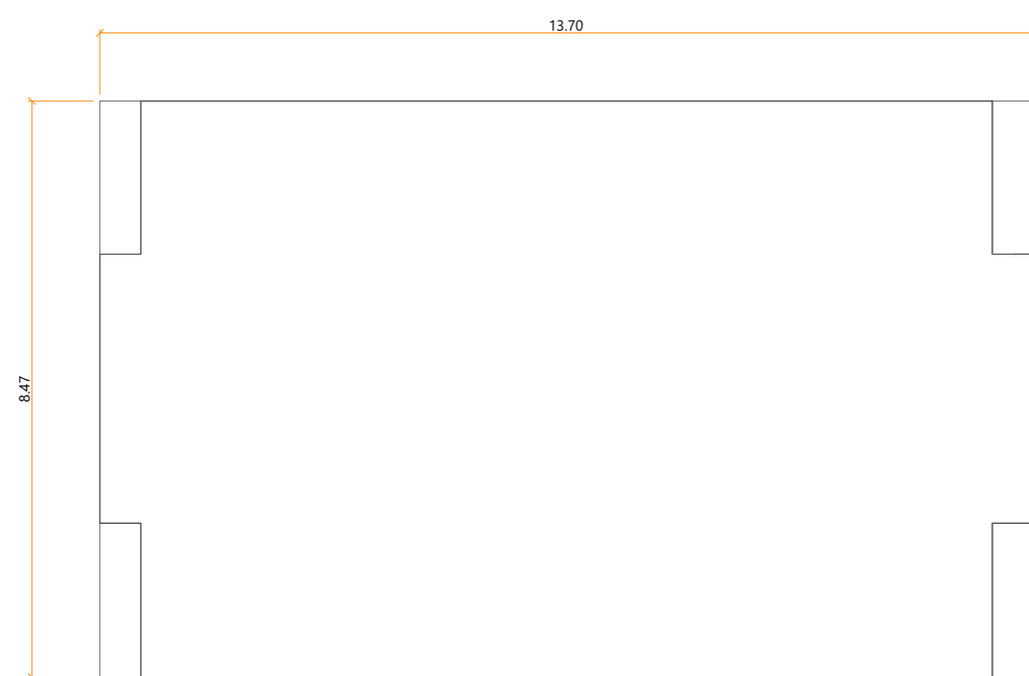
VISTA FUNDOS CAIXA PORTA REGISTRO - FOLHETARIA / CCSP MDF 6MM sem escala